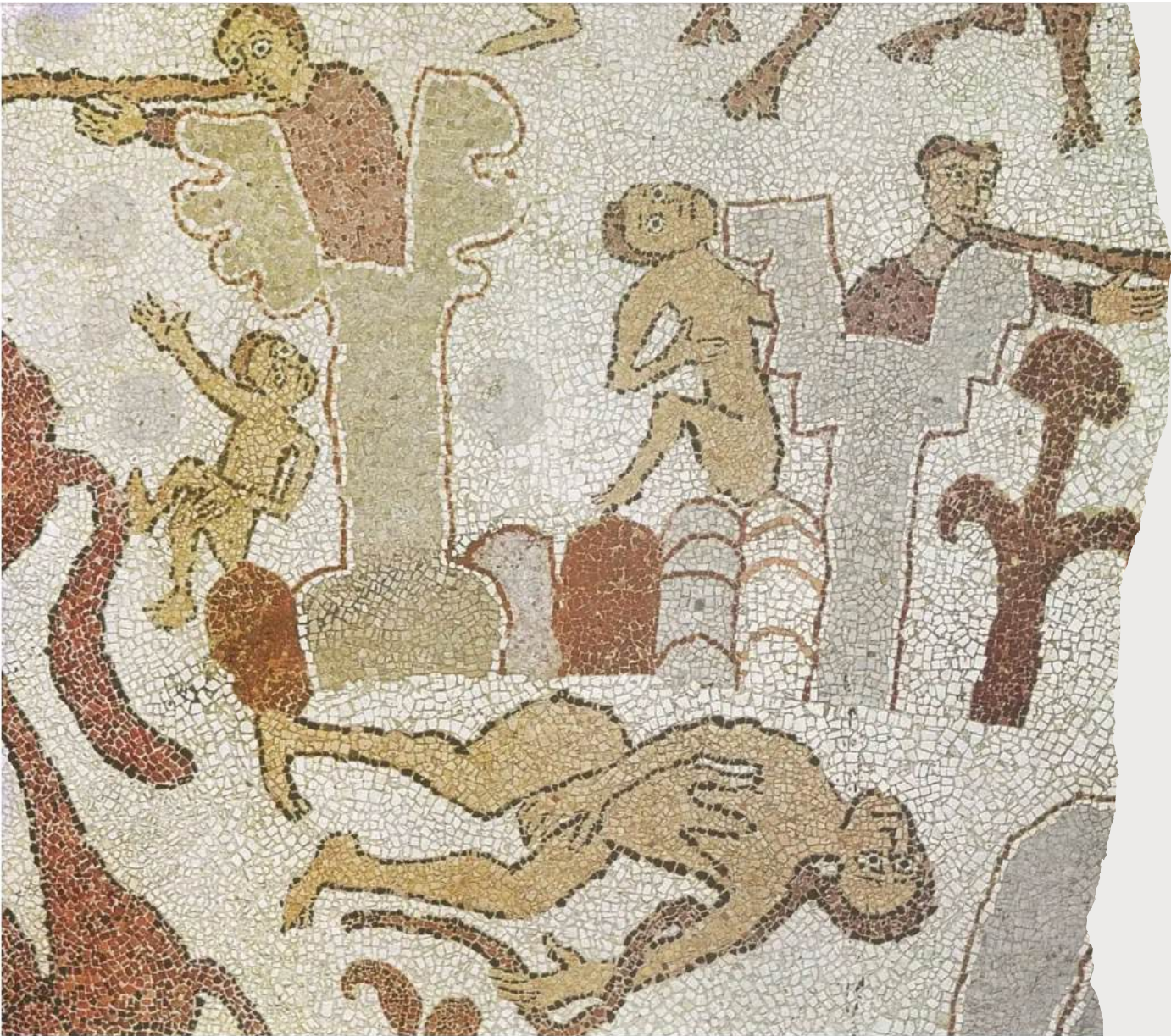
Mosaico della Cattedrale di Otranto